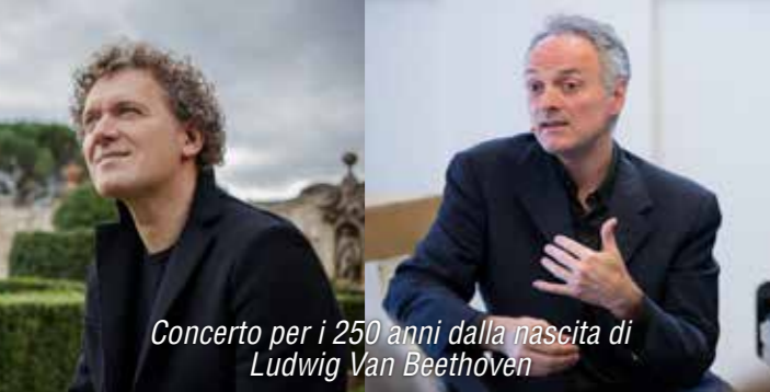
Concerto per i 250 anni dalla nascita di Ludwig Van Beethoven